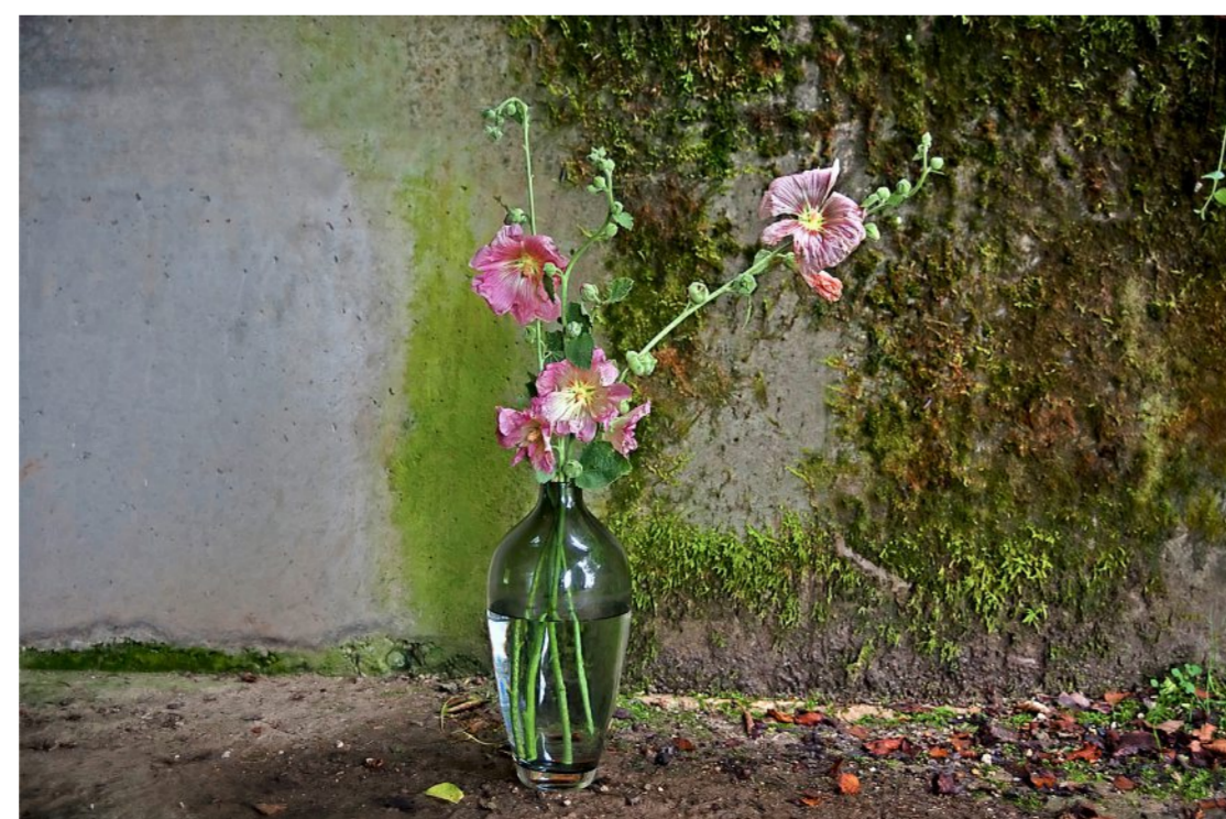
«Still Life #21» (2017).

künstlich, so offensiv mystisch muss man heimisches Gestrüpp erst einmal sehen können wie Sonja Maria Schobinger in ihrer «Trees»-Serie.