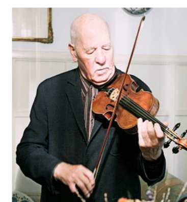
Hansheinz Schneeberger im Jahr 2015.

Unter den ungezählten Konzerten, die der 1926 geborene Berner – Sohn einer Lehrerin und eines Lokomotivführers – gegeben hat, ragt musikgeschichtlich eines hervor: die Uraufführung des ersten Violinkonzerts von Béla Bartók, 1908 komponiert und erst 50 Jahre später vom Basler Kammerorchester unter Paul Sacher in Basel erstmals zur Wiedergabe gebracht. Bartók blieb ein Favorit des Geigers Schneeberger, der auch die Schweizer Erstaufführung des zweiten Vio-