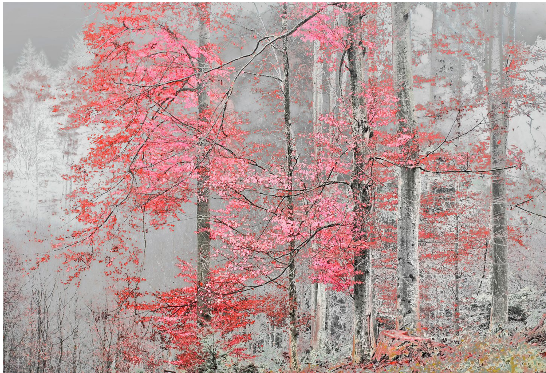
«Trees #30» (2018).