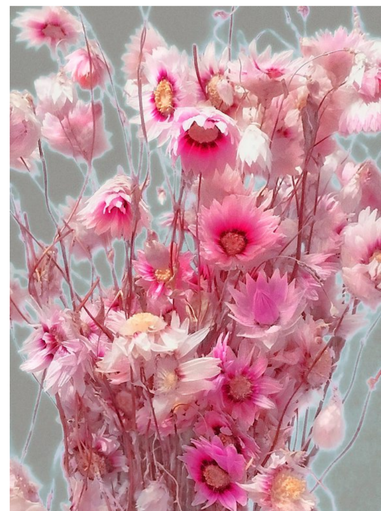
«Helichrysum» (2017).

Ausstellung Die Galerie Carzaniga zeigt die fotografische Kunst der Baslerin Sonja Maria Schobinger.